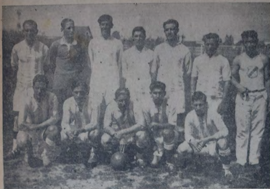
EQUIPO DE LA FEDERACION CHAQUEÑA