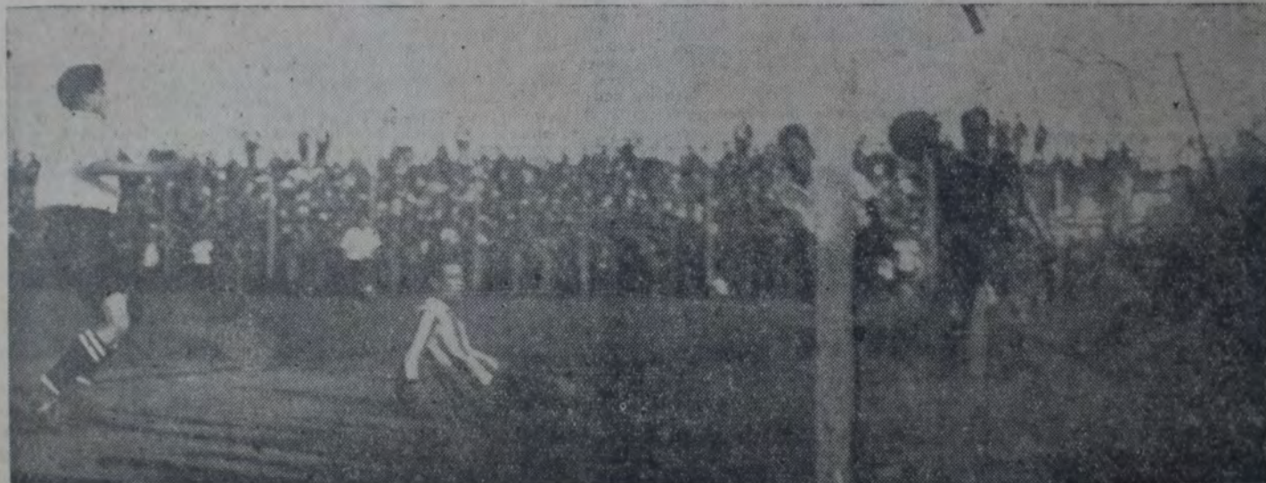
EL CUARTO GOAL DE LOS SANTIA GÜEROS