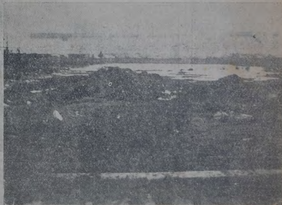
EN NUEVA POMPEYA, EL BALDIO QUE REPRODUCIMOS, LO LLAMAN "QUINTA LAS MERCEDES". DE quinta no tiene nada, salvo que se considere buena cosecha de coles la basura acumulada y los tachos inmundos... No falta allí la lagunita tradicional. Por si le interesa o le tienta para ir de pícnic a tan poético lugar, le aseguramos al señor intendente que esa "Quinta Las Mercedes" la encontrará entre las calles Riestra, Centenera y avenida Cruz.