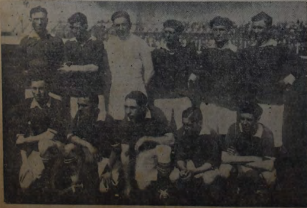
CUADRO DE LA LIGA RAFAELINA

Con este resultado el cuadro santiagueño debe jugar con el equipo de la