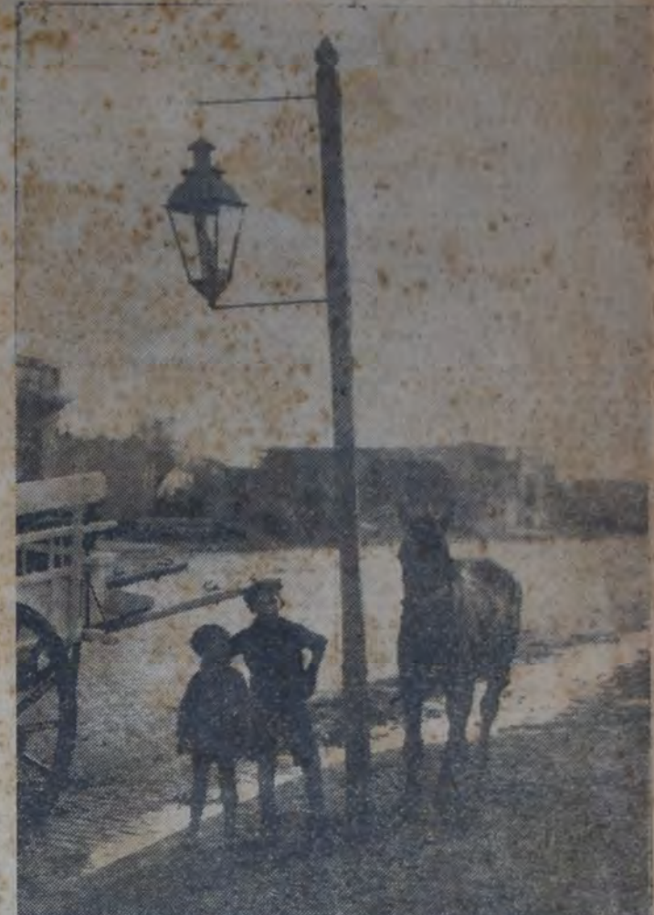
ARTISTICO FAROL CON LUZ DE QUEROSENE, EN USO EN LA AVENIDA de la Riestra. Las casas particulares tienen todas luz eléctrica. Qué espera, pues, el departamento ejecutivo para cumplir la ordenanza del concejal socialista Alejandro Castañeras, cuyo primer artículo dice: "El D. E. por intermedio de la Dirección de Alumbrado, proveerá a la instalación inmediata de alumbrado eléctrico provisorio en todos los barrios o zonas suburbanas de la ciudad donde las compañías de electricidad hayan extendido de sus cables y exista servicio eléctrico privado". Sobre este y otros problemas edilicios de Nueva Pompeya, Norte encontrará el lector una interesante nota en las páginas 6 y 7 de esta edición.