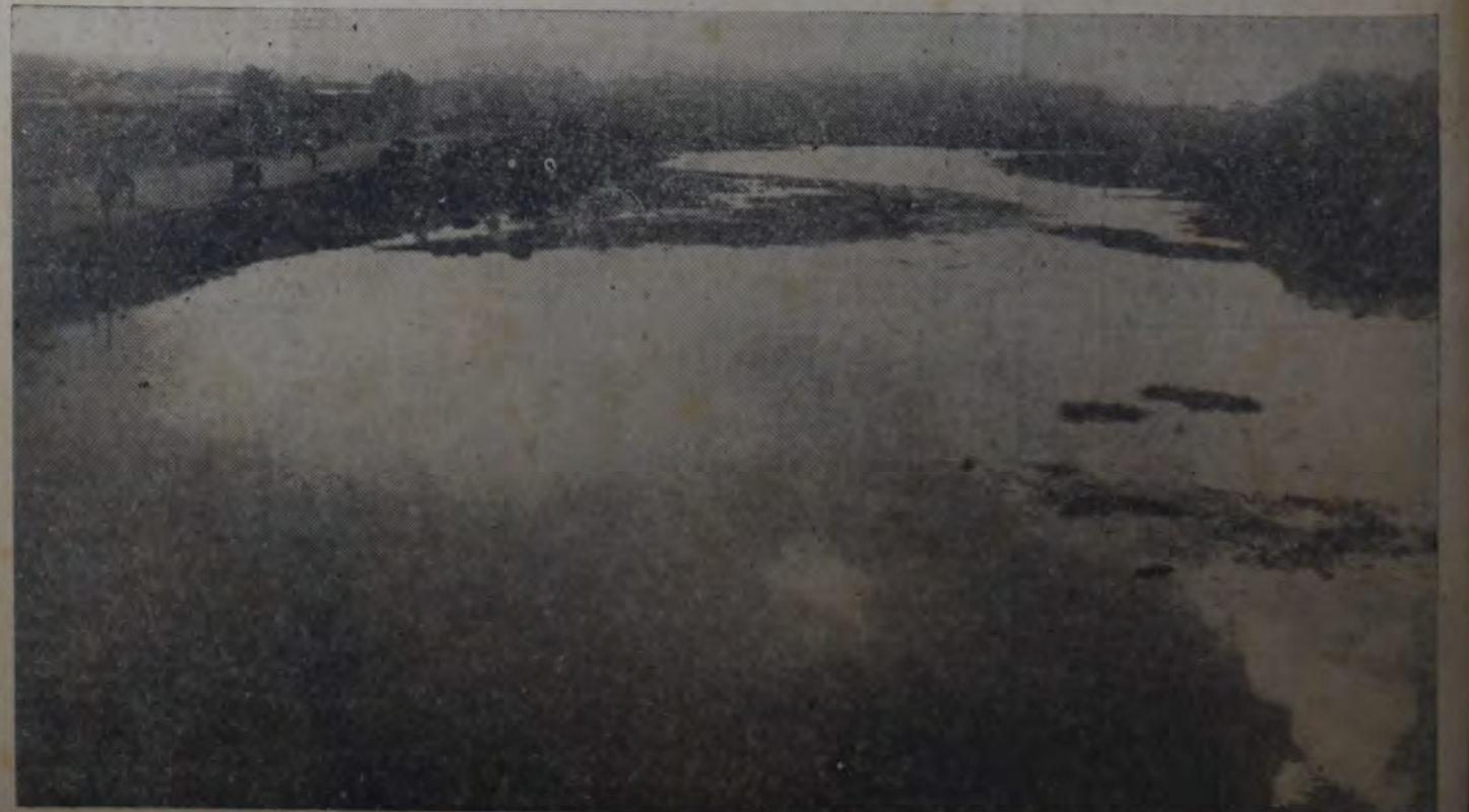
ESTO QUE CONTEMPLAS, ASOMBRADO LECTOR, NO ES LA LAGUNA DE CARHUE, NI LA VISION PANORAMICA DE ALGUNA TRANQUILA Y BRUMOSA bahía de Tierra del Fuego. Esta es la "gran laguna" y no de aguas medicinales de Pompeya Norte, formada por los cuidados del propietario de infante horno de ladrillos. Antes, esto era alto, tanto como el mismo horno. Por ahí, en primer término debe correr la calle Lanza. A la izquierda ves la avenida de la Riestra. Obsérvese la diferencia de nivel, que prueba acabadamente la incompetencia, la dedicación, la honestidad con que cumplen sus funciones los burocratas del departamento ejecutivo municipal.

Esperamos que algún día la intendencia se resolverá a cumplir con su deber, en los términos claros que leemos en la siguiente resolución del concejal socialista Angel M. Giménez, aprobada por el concejo deliberante en la sesión del 18 de septiembre p.p.d., y que textualmente dice: "El D. E., por sus correspondientes reparticiones, hará realizar una amplia inspección de los hornos de ladrillos, en todo lo que se refiere al cumplimiento de las disposiciones del Digesto Municipal y una investigación sobre la forma cómo han sido concedido los respectivos permisos, debiendo elevar