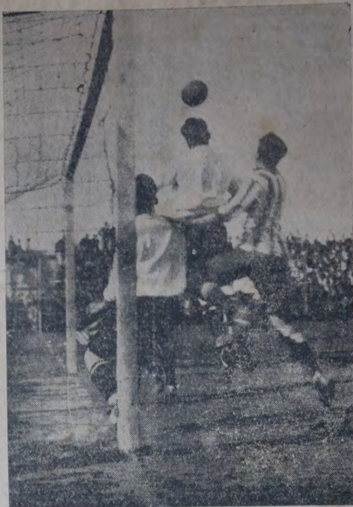
UNA SITUACION DIFICIL PARA LA VALLA SANTIAGUENA

Las últimas acciones siguieron reñidas, pero el período reglamentario se cumplió con este resultado: