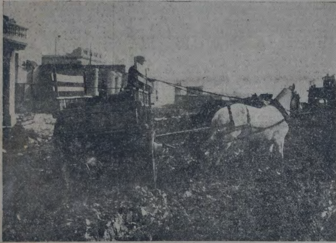
AUNQUE TENEMOS LA SENSACION DE ENCONTRARNOS ENCAJADOS EN ALGUNA HUELLA DE LA PAMPA, estamos en presencia nada menos que de una avenida de la ciudad de Buenos Aires: la avenida Cobo, cuya pavimentación han solicitado a porfía la sociedad de fomento del barrio Colón y los concejales socialistas. Es exageración afirmar que los vecinos de los barrios suburbanos están aislados? Qué acción municipal revela espectáculo tan denigrante? La intendencia debe decidirse a cumplir el mínimo de urbanización proyectado por el concejal socialista Alejandro Castiñeiras y aprobado ya por el concejo deliberante.