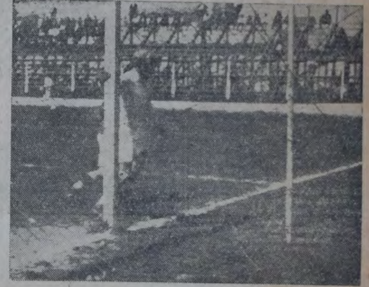
UN TIRO DESVIADO DE LOS JUJEÑOS

Este encuentro se realizará el próximo domingo 7 del mes en curso.