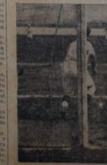
FRENTE AL ARCO DE JUJUY

Los nombrados en primer término, que eran ya conocidos por los aficionados, pues ya participaron, en estos certámenes, conquistando en el año 1927 el segundo puesto en la tabla final del campeonato, bajaron a la capital federal con el antecedente ya mencionado, dando lugar a que se le considerara un conjunto de valores positivos, y asignándole en esta oportunidad más chance, que su adversario, que con el partido jugado ayer, hizo su primera presentación.