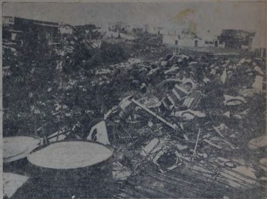
UN BALDIO SITO ENTRE LAS CALLES RIESTRA Y CHICLANA. A LA ESPERA DE LA VALORIZACION, EL propietario lo destina a depósito de tachos viejos, etc. No faltan basuras. Nos preguntamos: para qué la ciudad pagará un costoso cuerpo de inspectores municipales? Acaso, las ordenanzas se dictan para que los burlen propietarios desaprensivos, antisociales?

Pero, el departamento ejecutivo ha seguido preocupándose poco de los barrios suburbanos. Del vasto plan socialista, sólo una pequeña parte ha ido cumpliendo. Prefiere, quizás, que los millones del empréstito sigan perdiendo crecidos intereses en las arcas de los bancos? Tendrán, por lo menos, mejor suerte los proyectos presentados por el concejal socialista Manuel Palacin en la sesión de septiembre 25 próximo pasado y que ordenan al departamento ejecutivo construya pasajes de piedra y cunetas de desagüe en el barrio comprendido entre las calles Curapaligüé, Directo-