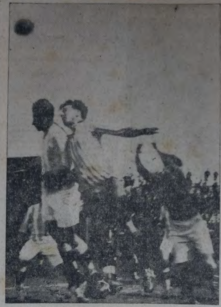
NTE A LA VALLA CATAMARQUEÑA UN SERIO AMONTONAMIENTO FRE