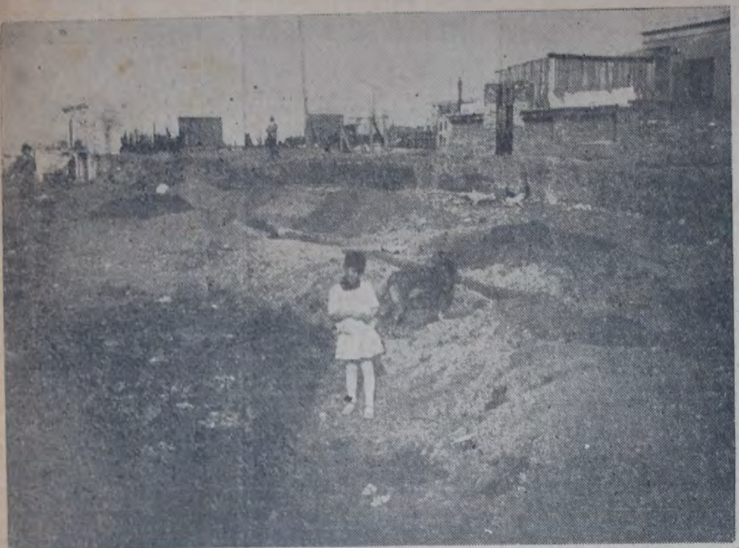
CALLE ZELARRAYAN. POR CONTRATO PRIVADO A DOS AÑOS, QUE LOS VECINOS QUISIERON ANULAR, LA PAVIMENTACION. NÓTESE A QUÉ ALTURA QUEDARÁN LAS CASAS UNA VEZ TERMINADO EL DESMONTE. EN ESTA PARTE EL NIVEL DE OBRAS SANITARIAS ES TODAVÍA UN METRO MÁS BAJO. EVIDENTEMENTE, LOS MORADORES DE LA CALLE ZELARRAYAN DEBERÁN PROVEERSE DE ASCENSORES PARA LLEGAR A SUS CASAS.

Es inmenso el trabajo de urbanización que debe realizarse en Buenos Aires, si se quiere transformar el barrizal que hoy es en una ciudad relativamente moderna, con el mínimo de servicios y de comodidades asegurado. A esta im-