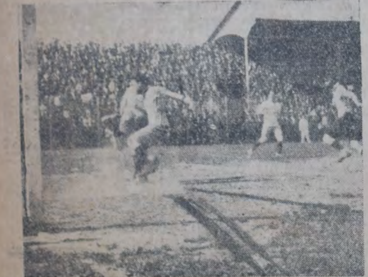
EN LAS INMEDIACIONES DEL ARCO CHAQUERO