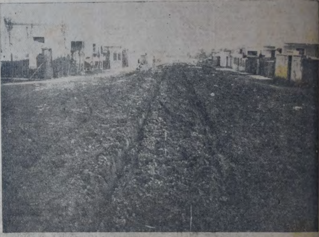
CALLE DEL BARADO. NO SABEN LO QUE ES UN PEÓN MUNICIPAL. NI UN CARRÓ DE RECOLECCION DE BASURAS. BIEN ES CIERTO QUE SI ALGUNO SE ARRIESGARA, NO SALDRÍA DE ALLÍ. DE CUNETAS, DESAGÜES, CONOCEN ALGO DE OÍDAS. ALGÚN PASO DE PIEDRA CONSTRUIDO POR LA SOCIEDAD DE FOMENTO SE ENCUENTRA, O MEJOR, SE ADVIENE, PORQUE SI TODO LO CUBRIRÍ. ¿PENSAR QUE LOS MOTADORES DE ESA CALLE PAGAN IMPUESTO DE ALUMBRADO, BARRIDO Y LIMPIEZA? ¿PARA CONTRIBUIR A PAGAR EL ALUMBRADO, EL BARRIDO Y LA LIMPIEZA DE LA AVENIDA QUINTANA?

¡Maravillosa previsión municipal! ¡Ahora deberá rellenar con basuras lo que era terreno sólido y alto! ¡Siempre el eterno tejer y destejer! ¡Qué extraño, pues, que los millones municipa-