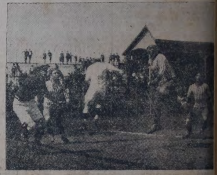
FRENTE AL ARCO DE CATAMARCA