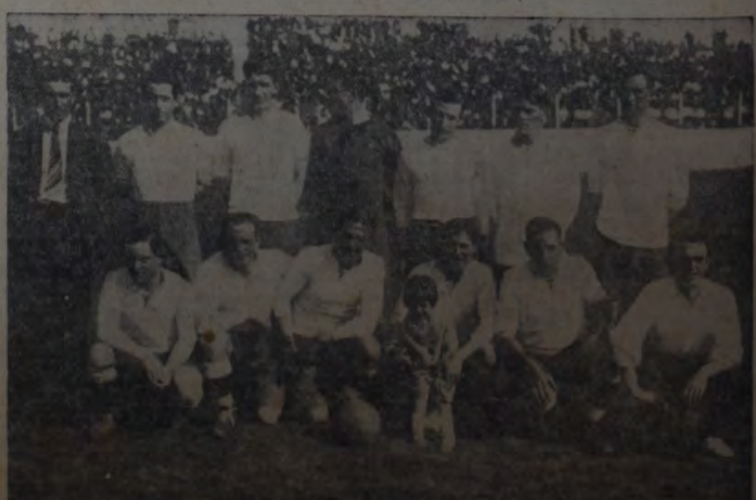
CUADRO DE LA LIGA ROSARINA