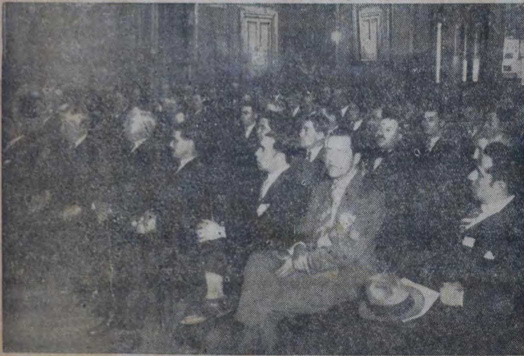
UN ASPECTO DEL PUBLICO QUE ASISTIO A LA CONFERENCIA DEL DOCTOR NICOLAS REPETTO EN LA Federación de Sociedades Gallegas.

Cómo estaba anunciado, se realizó ayer en el salón de actos de la Federación de Sociedades Gallegas, Salta 1155, la conferencia del doctor Nicolás Repetto sobre el tema "Competencia o cooperación?"