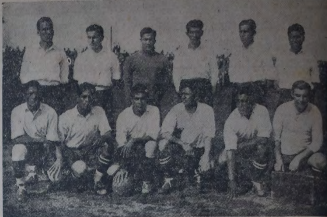
CONJUNTO DE LA LIGA CULTURAL, DE SANTIAGO DEL ESTERO