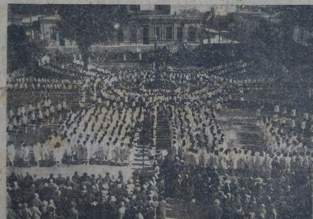
EN LA ESCUELA NORMAL NUMERO 4 Y LICEO DE SEÑORITAS SE REALIZO AYER UNA FIESTA PARA festejar la entrada de la primavera. Nuestro grabado muestra un hermoso conjunto de niñas durante la interpretación de un "Canto al Sol" que constituyó uno de los números que integraron el interesante programa de esta fiesta.

De ahí que la solución con el servicio de tres meses como lo quiere el Partido Socialista fuera recibida en todas las reuniones con la más franca y celerosa aprobación.